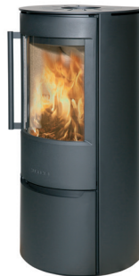
WIKING Luma 4