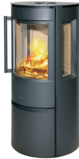
WIKING Luma 3