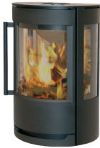
WIKING Luma 1