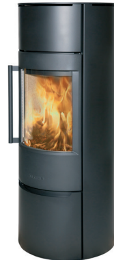
WIKING Luma 6