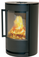
WIKING Luma 2