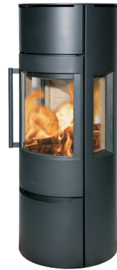
WIKING Luma 5