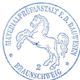
Dr.-Ing. K. Herrmann Leiter der Prüfstelle

Gegen dieses allgemeine bauaufsichtliche Prüfzeugnis kann innerhalb eines Monats nach Zugang Widerspruch erhoben werden. Der Widerspruch ist schriftlich oder zur Niederschrift bei der Leitung der Materialprüfanstalt für das Bauwesen, Beethovenstraße 52, 38106 Braunschweig einzulegen. Maßgeblich für die Rechtzeitigkeit des Widerspruchs ist der Zeitpunkt des Eingangs der Widerspruchsschrift bei der Materialprüfanstalt für das Bauwesen.